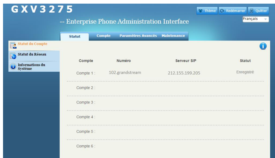
Figure 3 : L'état de l'enregistrement du compte SIP

NB: Vous pouvez vérifier l'état de l'enregistrement de votre compte sur l'onglet statut qui montrera l'activation de votre compte.