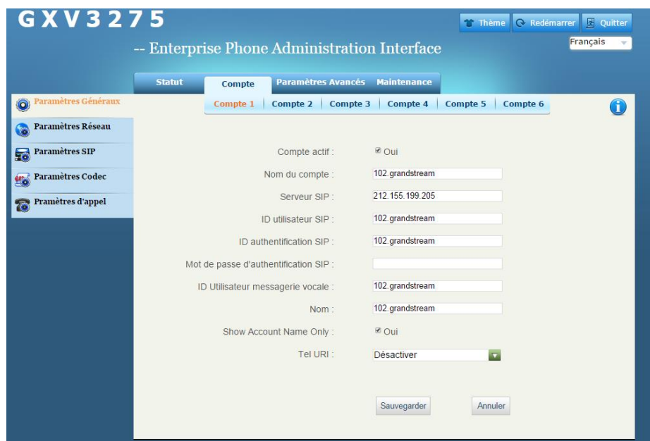
Figure 2: Menu des paramètres généraux des comptes

NB: Vous pouvez vérifier l'état de l'enregistrement de votre compte sur l'onglet statut qui montrera l'activation de votre compte.