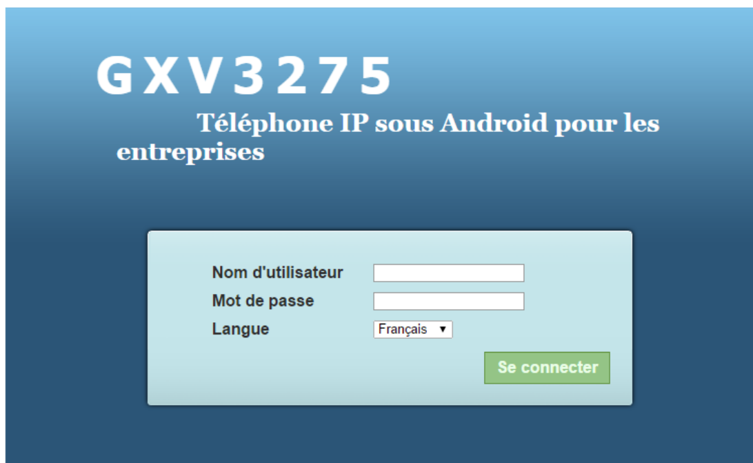
Figure 1 : Interface d'authentification