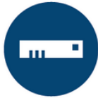
Routeur Edge X