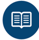
Guide d'utilisation Quick Start Guide